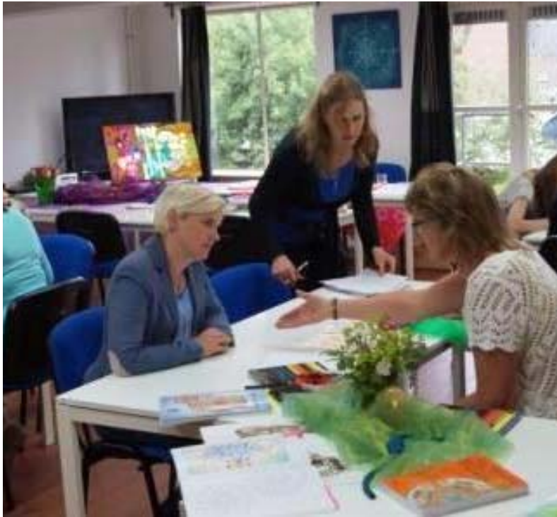
Tijdens de oefensessies in De Kolam